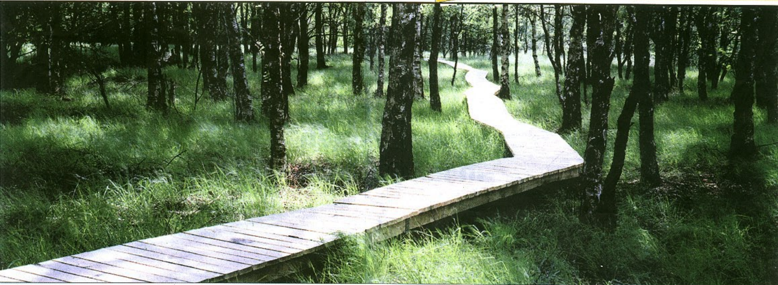
Het symbolische pad door het moeras in Bathorn van Peter Fischli en David Weiss.